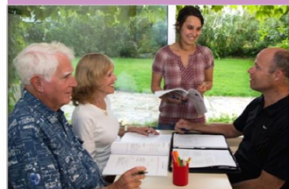
Cours de Français