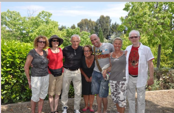
Nos étudiants à Antibes