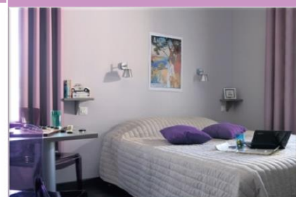
Studio dans la résidence "Aragon"